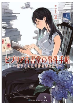
ビブリア古書堂の事件手帖 ～菓子さんと奇妙な客人たち～ 定価: 本体590円＋税 発売日: 2011年3月25日