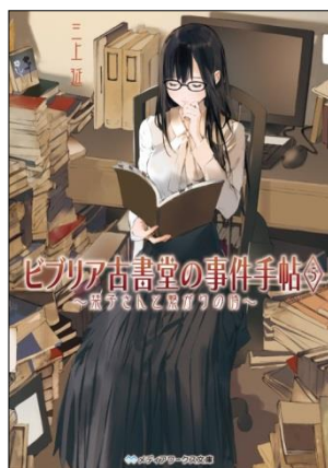
ビブリア古書堂の事件手帖5 ～菓子さんと繋がるの時～ 定価: 本体570円＋税 発売日: 2014年1月24日