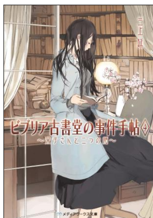
ビブリア古書堂の事件手帖4 ～菓子さんと二つの顔～ 定価: 本体570円＋税 発売日: 2013年2月22日