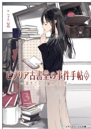
ビブリア古書堂の事件手帖2 ～菓子さんと謎めく日常～ 定価: 本体530円＋税 発売日: 2011年10月25日