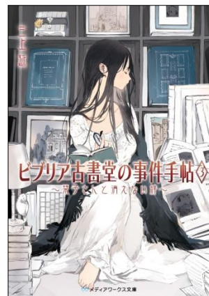
ビブリア古書堂の事件手帖3 ～菓子さんと消えない絆～ 定価: 本体550円＋税 発売日: 2012年6月23日