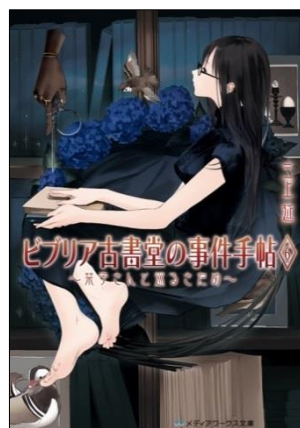
ビブリア古書堂の事件手帖6 ～菓子さんと巡るさため～ 定価: 本体570円＋税 発売日: 2014年12月25日