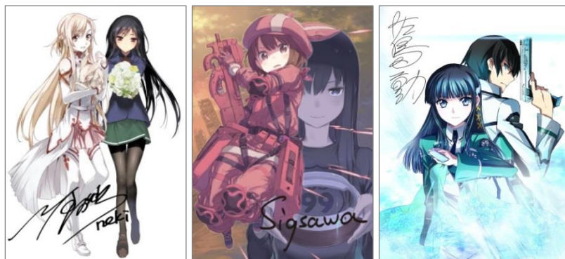
↑ 著者直筆サイン入り複製原画 イメージ