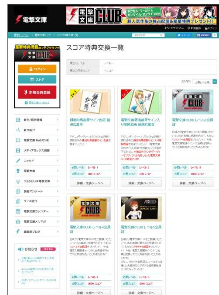
↑ スコア特典交換一覧ページ イメージ