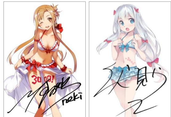
↑ 著者直筆サイン入り複製原画 イメージ画像

●電撃文庫3000タイトル突破!!大感謝フェア 公式サイト: http://dengekibunko.jp/3000/