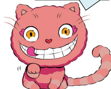
ホラーで奇妙な有名キャラクター 「笑い猫」