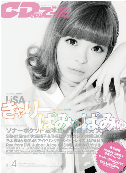
『CD&DLで一た』4月号カバー

創刊28年目となる、“音楽がもっと好きになる”音楽情報誌(奇数月14日発売)。J-POPを中心としたアーティストのロングインタビューやコラムなど、様々なコンテンツを取り扱っています。