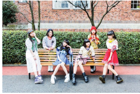
Little Glee Monster